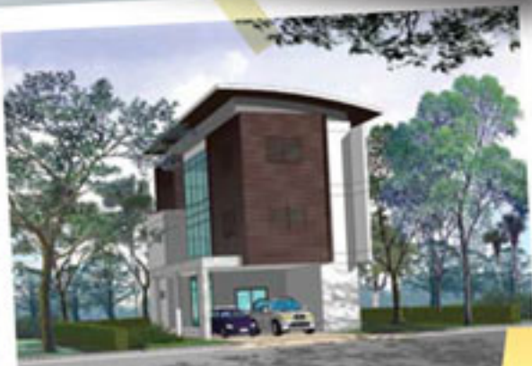
Series B : HOME OFFICE

ให้เลือกลงตัวกับขนาดที่ดินและงบประมาณตามต้องการ