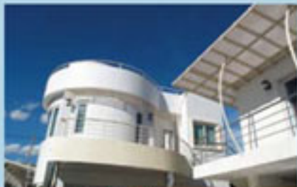
คุณองอาจ โชคชัยทวีสกุล แบบบ้าน HS 403/Modern Style พื้นที่ใช้สอย 572 ตร.ม. ที่ดิน 98 ตร.ว.