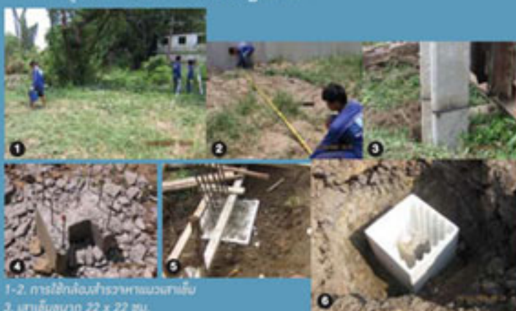
1-2. การใช้เครื่องมือสำรวจหาแนวเสาเข็ม 3. เสาเข็มขนาด 22 x 22 ซม. 4. การตัดหัวเสาเข็มด้วยเครื่องเจียร 5. งานฐานรากใช้ Footing Box ทุกคอก 6. Footing Box ปิดทับกันหมิ่นทูนย์