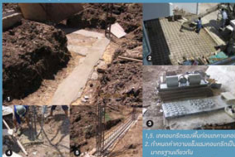
1,5. เทคอนกรีตรองพื้นก่อนเทคานทอง 2. กำหนดค่าความแข็งแรงคอนกรีตเป็น มาตรฐานเดียวกัน 3. ลูกปูนที่ใช้ในการฐานเดียวกัน 4. ใช้เครื่องมือคอนกรีตทุกตัว