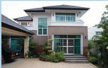
คุณประภัสสร มาลาภาณูจน์ แบบบ้าน New Design/Modern Contemporary Style พื้นที่ใช้สอย 322 ตร.ม.