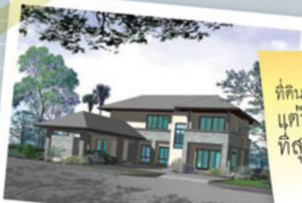
Series A : MODERN TROPICAL