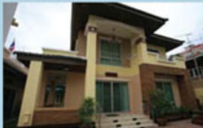
คุณฉันทนา เอ็นนาน แบบบ้าน E-CR/Contemporary Style พื้นที่ใช้สอย 303 ตร.ม. ที่ดิน 68 ตร.ว.