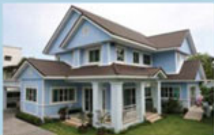
คุณอนุชา แคนตกุล แบบบ้าน HS 202/American Country Style พื้นที่ใช้สอย 316 ตร.ม. ที่ดิน 109 ตร.ว.

ขอต้อนรับสมาชิกใหม่เมคเกอร์โฮมทั้ง 8 ครอบครัว กับดีไซน์บ้านสวยแตกต่างกัน หลากหลายสไตล์ ผลงานการก่อสร้างของ Professional Construction Team โดยเมคเกอร์โฮม