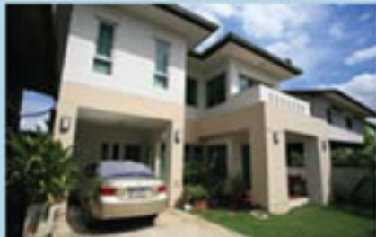
คุณจักรกฤษณ์ นพคุณ แบบบ้าน New Design/Modern Contemporary Style พื้นที่ใช้สอย 193 ตร.ม. ที่ดิน 50 ตร.ว.