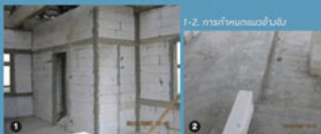
1-2. การกำหนดแนวอ้างอิง