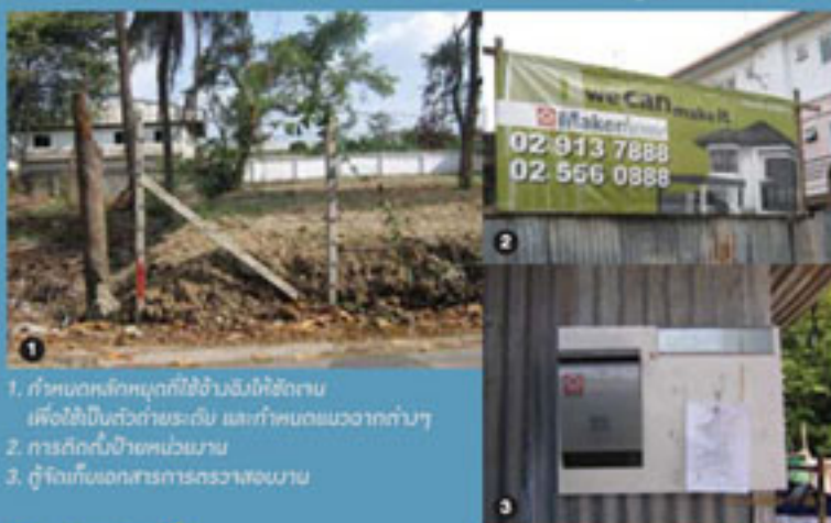
1. กำหนดหลักเกณฑ์ปักไม้จิ้มฟันไว้ชัดเจน เพื่อใช้ปักระดับด้วยระดับ และกำหนดแนววางต่างๆ 2. การปักไม้ปักแนวเดียวกัน 3. ตู้จัดเก็บเอกสารการตรวจสอบงาน